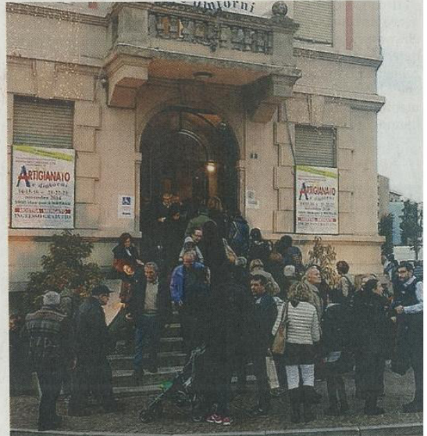
Folla all'ingresso del Palazzo delle Esposizioni

«Chi ha potuto ha riassorbito l'esposizione con nuovi prodotti, che fortunatamente si trovavano nei magazzini vicini al Palazzo, altri invece hanno concluso la giornata e le vendite con netto anticipo». Registrato così un tutto esaurito di pubblico e anche di mercanzia.