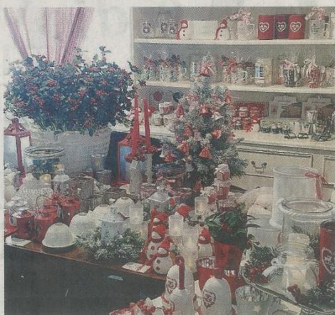
Una delle scorse edizioni di "Artigianato e dintorni"

Il Palazzo Storico si trasforma in contenitore di streghe. «Ottantacinque gli espositori che per questa sedicesima edizione ospitiamo a Mariano con un pubblico atteso di circa 15 mila persone pro-