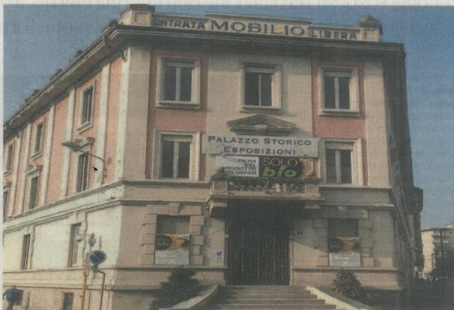
Nell'immagine: il palazzo storico delle Esposizioni in via Matteotti a Mariano Comense sede di "Solo Bio"

Da oggi apre le porte "Solo Bio", fiera mercato dedicata al mondo del benessere naturale, che per la seconda edizione porta al Palazzo Storico delle Esposizioni di Mariano Comense circa 70 espositori, provenienti da tutta Italia. Dopo l'importante successo dello scorso anno, quando sono arrivati oltre 10mila visitatori, ecco dunque rinnovato l'appuntamento con il mondo della salute e del biologico, declinato a ogni aspetto del nostro vivere quotidiano. "Solo Bio" si svela dunque per tre giorni, dalle 10 alle 20, con ingresso gratuito. La manifestazione si basa sui punti enunciati da Expo 2015: ovvero alimentazione come energia vitale del pianeta, per uno sviluppo sostenibile basato su un corretto e costante nutrimento del corpo. Il mondo "bio" oggi è un'alternativa salutare e gustosa di mangiare e vivere. Questo ormai è un principio assoluto su cui molti consumatori fondano i propri comportamenti e acquisti. Come, per altro, testimoniato da un trend molto positivo del mercato di settore, in netta crescita. Questo perché gli alimenti