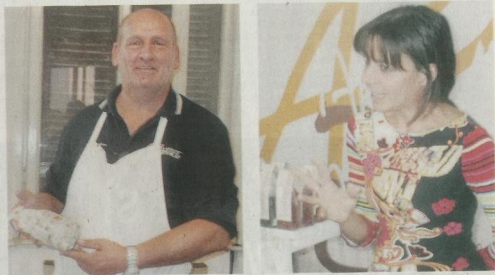
L'evento ripercorre le proposte cardine di EXPO 2015 nella sua riflessione sull'alimentazione e sostenibilità