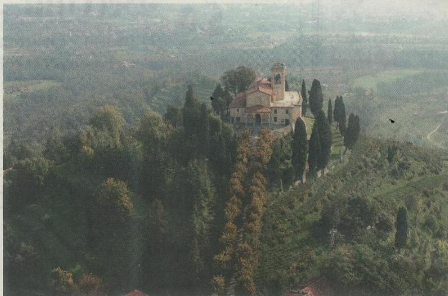
Montevecchia, suggestivo paese della Brianza lecchese i cui prodotti tipici saranno presenti a "Solo Bio"

Ricordate il profumo del pane? Quello che si sentiva da bambini dal panettiere o quando la nonna lo sfornava appena fatto in casa la domenica mattina? Quel profumo era la garanzia che sulla tavola sarebbe arrivato un prodotto semplice e genuino. Con il passare degli anni questo e molti altri aromi hanno rischiato di andare perduti. A "Solo Bio", l'occasione è quella di ritrovare questi profumi, legati alla nostra infanzia e alla sensazione di "buono". Un viaggio dalle atmosfere proustiane, per andare incontro a un futuro migliore, anche attraverso numerosi appuntamenti, laboratori, workshop e assaggi. Si comincia proprio oggi, venerdì 3 ottobre alle 15, con le degustazioni dei vini; mentre alle 16.30 l'associazione italiana per l'Agricoltura Biologica, partner della manifestazione, propone una merenda biologica. Alle 18, bagno sonoro di campane tibetane, a cura di "Benessere Web" che verrà riproposto ogni giorno alla stessa ora. Gli appuntamenti continuano sabato 4 ottobre: dalle ore 11 "Del monococco e