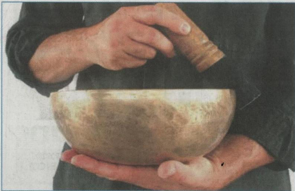
Durante la manifestazione si terranno diversi incontri, fra cui il “Bagno sonoro di Campane Tibetane”

“Expo Sana” non sarà solo l'occasione di fare ottimi acquisti di prodotti naturali, ma coinvolgerà anche il pubblico e gli espositori in una esperienza multisensoriale con workshop, laboratori, dimostrazioni e lezioni pratiche, il tutto grazie ad un fitto ed interessante calendario di incontri. Questi incontri si terranno al secondo piano del Palazzo Storico delle Esposizioni, e la partecipazione sarà libera e gratuita. Si comincia venerdì 24 gennaio, con i seguenti workshop: Bio Hair Care; Lezione sui Mudra - lo yoga dei sacri sigilli; bagno sonoro di Campane Tibetane; La danza degli occhi - metodi e strumenti per il benessere visivo naturale; Conoscere e vivere il Kundalini Yoga - Lo yoga della consapevolezza. Sabato 25 gennaio gli incontri continuano con: Introduzione all'Ayurveda Maharishi; Esperienze personali di Sciamanesimo; Oltre il velo dei Maya - L'origine spirituale della bellezza; Vegetarianesimo spirituale - Una filosofia di vita etica, spirituale e alimentare; L'omeopatia: che cosa offre per i problemi più ricorrenti; Alimentazione e Benessere; Conosciamo il Tai Chi; Bagno so-